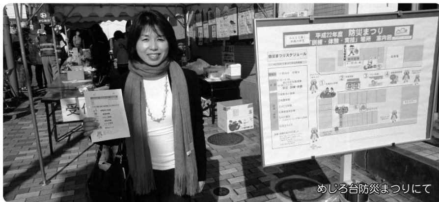
めじろ台防災まつりにて