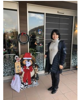
特別養護老人ホームの見学