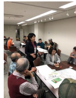
まちづくり市民講座