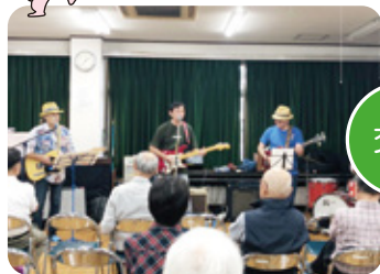
みなさんと一緒に地域で交流サロン

「身近なことから地域から」を合い言葉に地域密着で継続的に活動。まちの未来を皆さんと語り、学び、地域課題解決に向け取り組んできました。