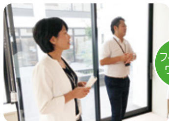
療養型病院の見学