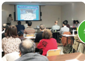
まちづくり市民講座の開催