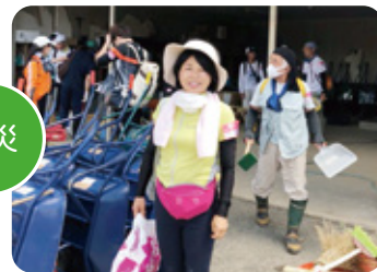
災害ボランティア活動